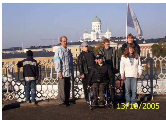
Utanför domkyrkan i Helsingfors

Vi gör också studiebesök. Förra hösten var vi till Helsingfors. Vi besökte olika sevärdheter bl.a. krigsmuseet och domkyrkan. Vi åkte också spårvagn.