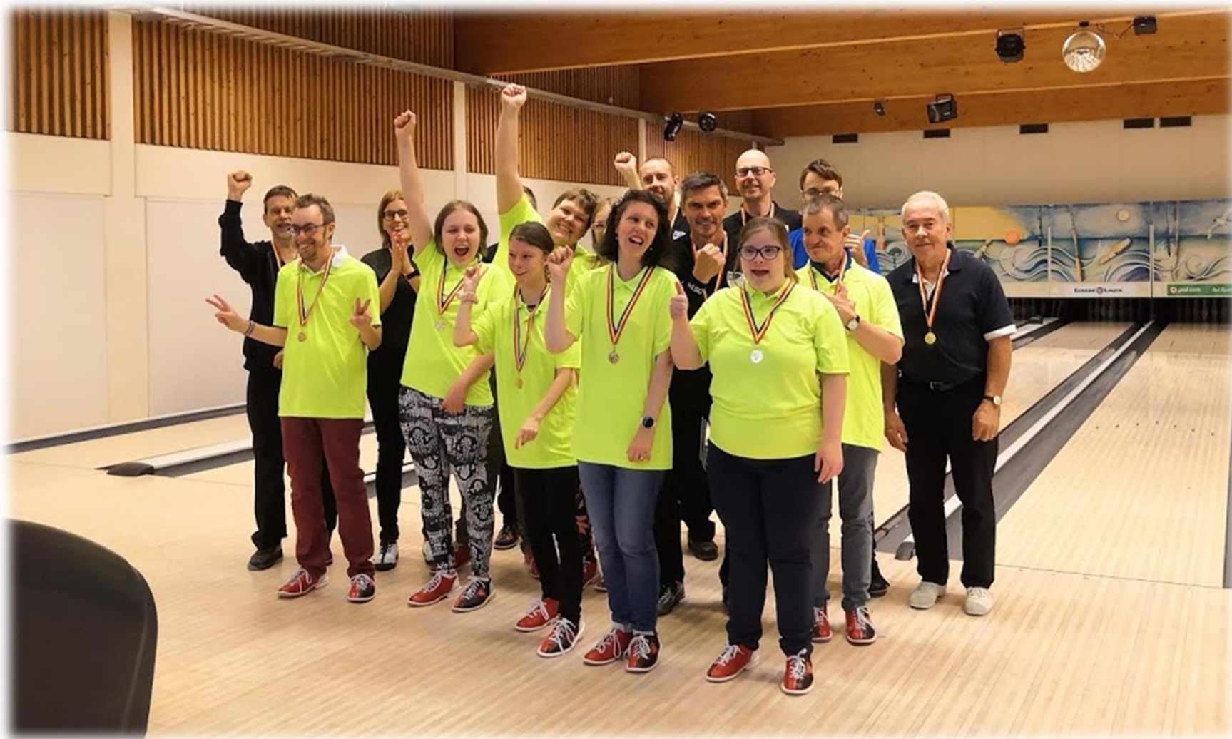
Bowlingtävlingen Opal Open tillsammans med Åland Bowlingförbund