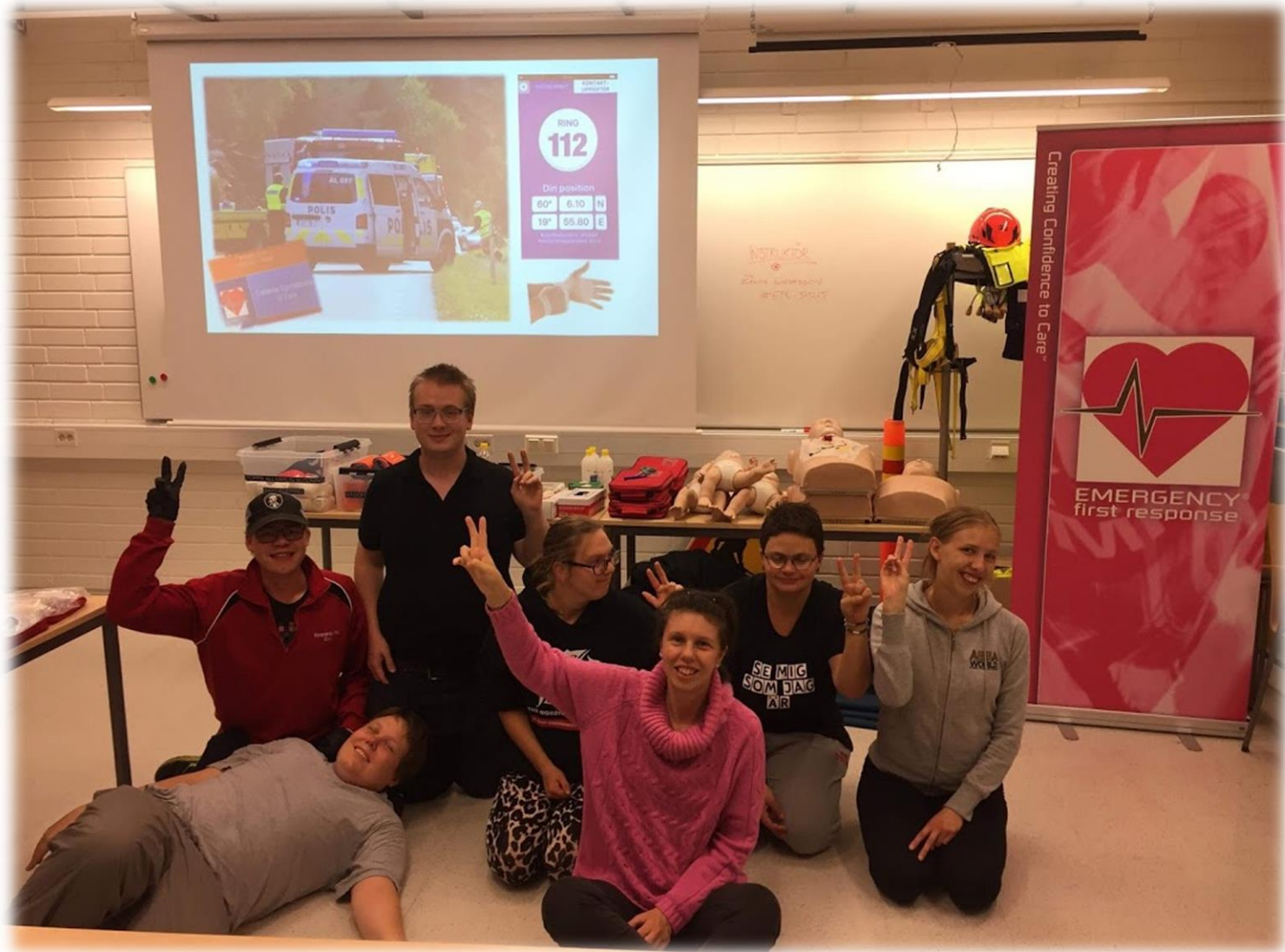
Första hjälpkurs i samarbete med Ålands Yrkesgymnasium